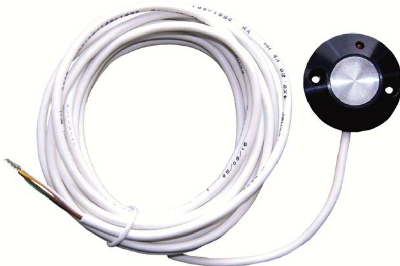
Рисунок 1 – Внешний вид пульта ДУ

Внешний вид пульта ДУ представлен на рисунке 1.